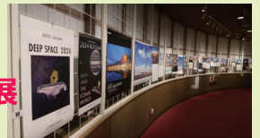
2024年全国カレンダー展の様子