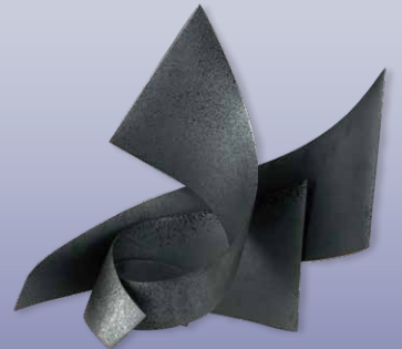
切り継ぎ一廻一 森山 寛二郎