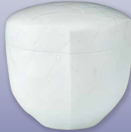
青白磁遊び網代文合子 ピーター・ハーモン (兵庫県在住)