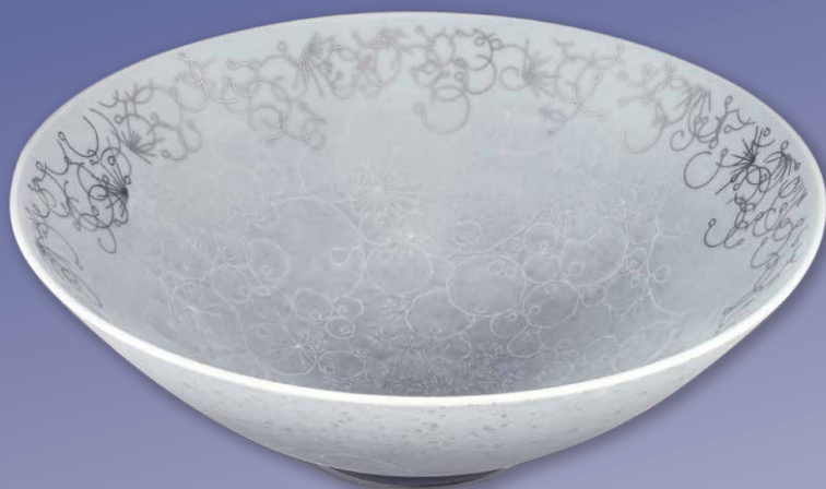
色絵薄墨墨はじき石路文鉢 今泉 今右衛門 日本陶芸美術協会会長 重要無形文化財保持者

休館日 月曜日(7/18祝を除く)、祝日の翌日(7/19火、8/12金) 開館時間 10:00～17:00(入館は16:30まで) 入館料 一般310(250)円、大学・高校生210(160)円、中学・小学生50(40)円