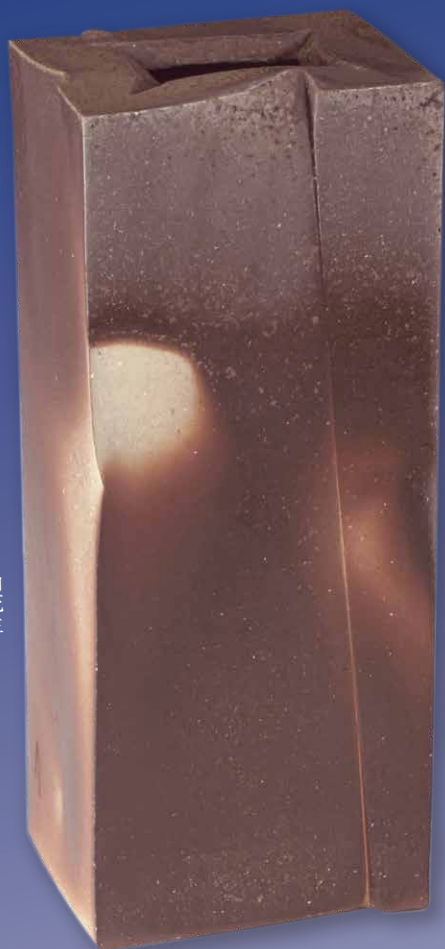
角花生 伊勢崎 淳 重要無形文化財保持者