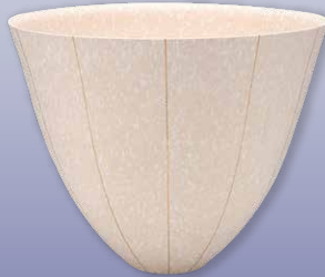
吹泥白丹波金彩器 清水 一二 (兵庫県在住)